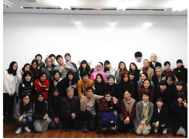
交換留學生送別會